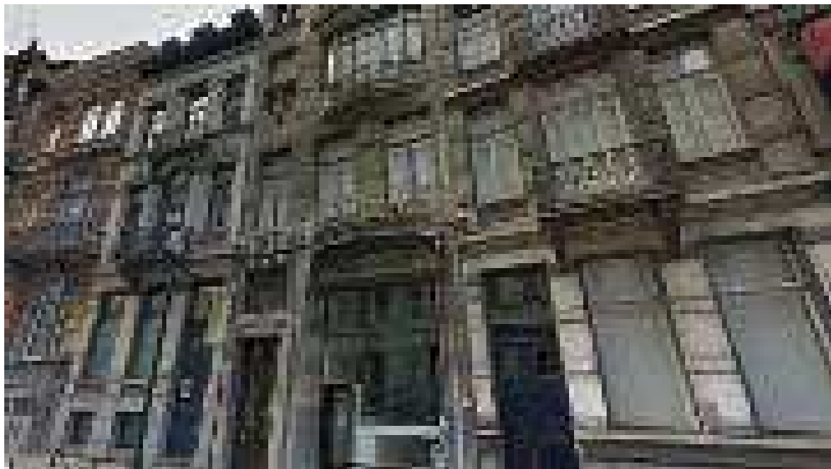
La maison est située au 37 de la rue Lebeau près du Sablon.