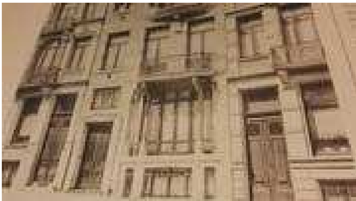
L'hôtel Frison, en 1894. La devanture commerciale n'existait pas encore.