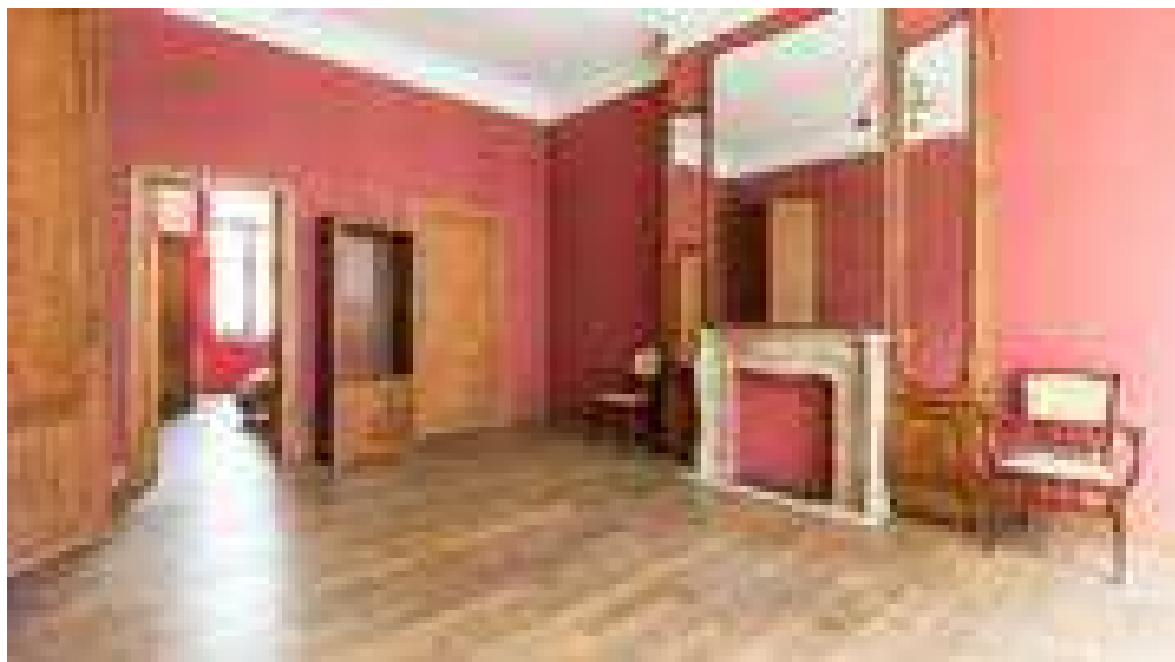
Les boiseries qui enserrant la cheminée en marbre.

Actuellement, le rez sert à l'occasion de galerie d'exposition temporaire voire de pop-up store. Il devrait en être de même avec le prochain propriétaire. Les étages resteront dévolus au logement.