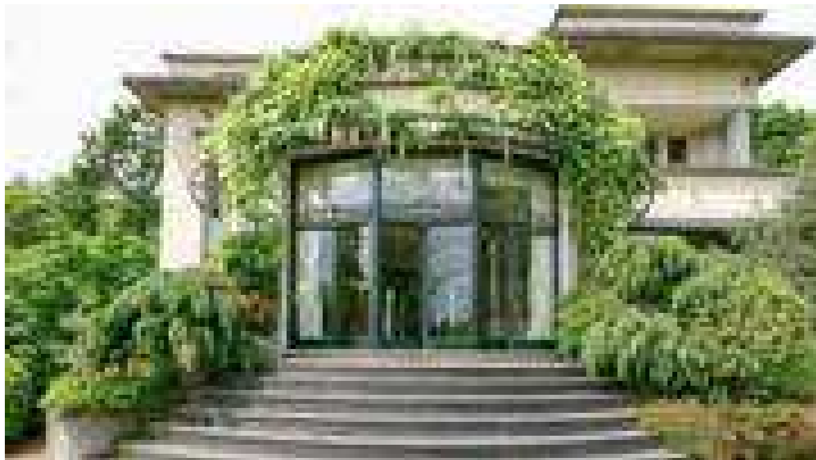
La Villa Horta, sur les hauteurs de Genval.